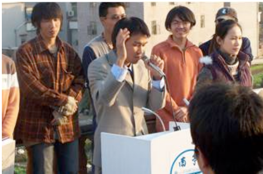
胡向前《蓝旗飘飘》，2006