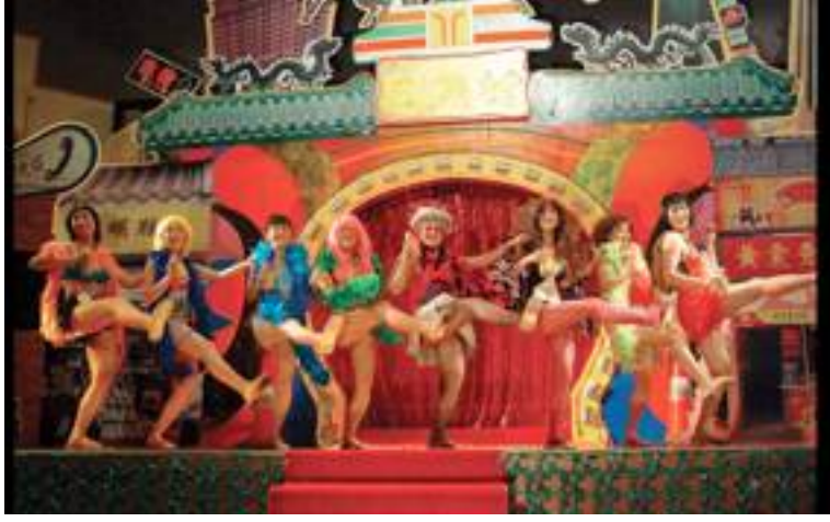
曹斐，《珠三角枭雄传》，2005年行为现场，第二届广州三年展，广东美术馆

“广东艺术家”，自九十年代中期从珠三角迷蒙的雾气中走出，新世纪伊始进入最风光的几年，之后随着整个艺术界生态的成长逐渐淡出人们视线，诱使许多过去被归入该群体的艺术家纷纷北上。如今，这个概念似乎已经离我们很远，简直可以回头做个初步的历史回顾。和多数事物一样，这个词也和国家大趋势有着深刻联系。“广东艺术家”最为人熟知的是他们对城市的介入，与岭南地区文化的关系倒不甚紧密，正因为如此，他们尤其适合代表中国艺术话语从政治象征主义到城市人类学的重大转变。在此过程中，地域标识慢慢动摇了当时国际艺术界对“中国当代艺术”的刻板理解。